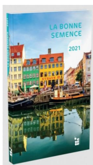
Livre de poche couverture souple 3,60€