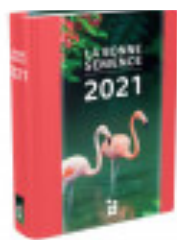
Livre relié Couverture rigide, 7,90€