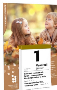
Bloc et plaque à effeuiller, à suspendre 4,70€